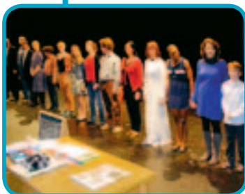
Medewerkers aan 'Alleen op de Wijde Wereld' nemen hun applaus in ontvangst.

Er zal een infomoment voor alle geïnteresseerden plaatsvinden op 3 juni om 20 uur in de raadzaal van het gemeentehuis. ●