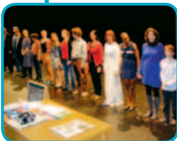
Medewerkers aan 'Alleen op de Wijde Wereld' nemen hun applaus in ontvangst.

Er zal een infomoment voor alle geïnteresseerden plaatsvinden op 3 juni om 20 uur in de raadzaal van het gemeentehuis. ●